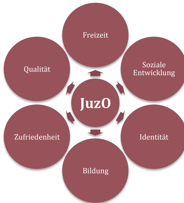
Abbildung 2: Das JuzO und seine Wirkungsziele

Die sechs Wirkungsziele sind zur Veranschaulichung in Abbildung 2 dargestellt.